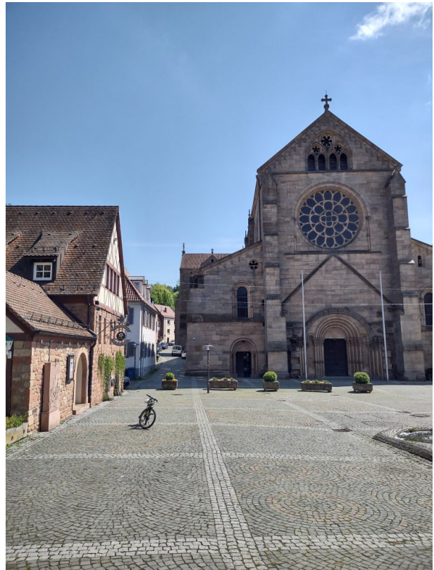
Kirchplatz und Haupteingang der Kirche (Arne Schwöbel, 2023)