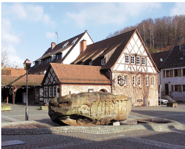
(VG Otterbach-Otterberg , 2019)