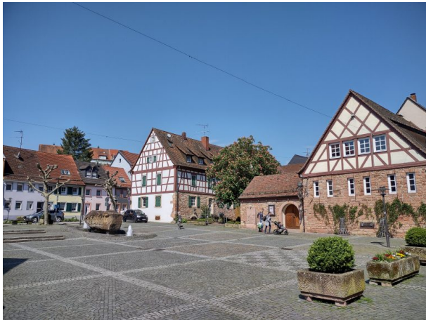
Kirchplatz mit Brunnen in Otterberg (Arne Schwöbel, 2023)