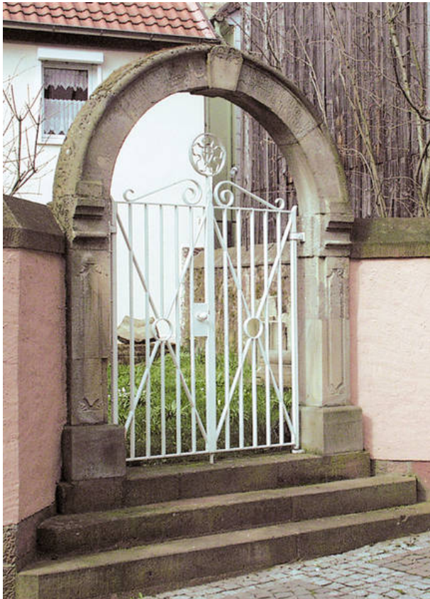
Portal der ehemaligen lutherischen Kirche in Otterberg (VG Otterbach-Otterberg, 2019)