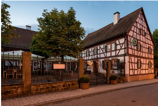
Historischer Kipperhof in Otterbach (Martin Koch, 2021)

Dana Taylor am 15.10.2019 um 14:48:20Uhr