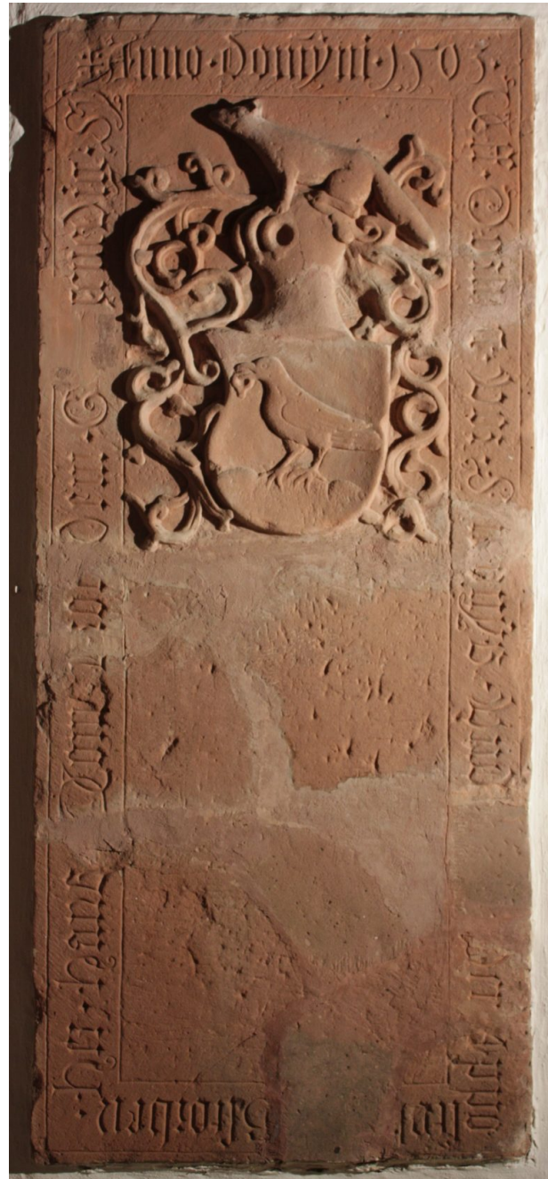
Grufplatte des Ritters Hans von Droth 1503 (Albert Nagel, 2017)