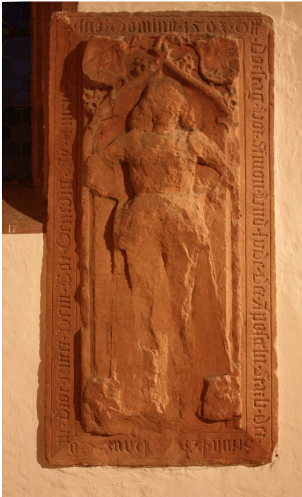
Grabstein des Ritters Hans von Droth 1503 (Albert Nagel, 2017)